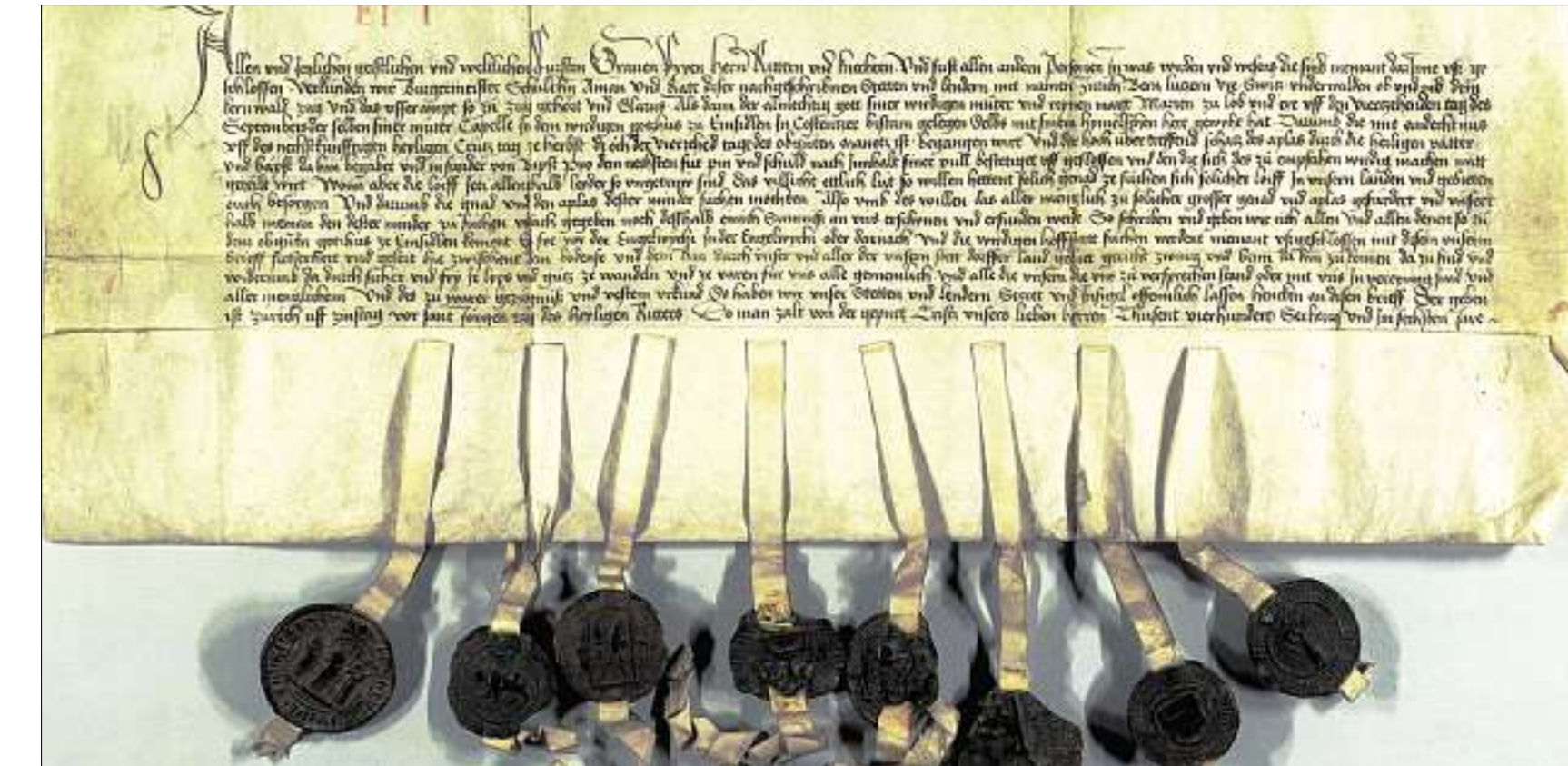
Zum sankt-gallischen Einflussgebiet des Klosters Einsiedeln gehörte insbesondere Kaltbrunn und Rapperswil. In diesem Beispiel verlieh Abt Burkhard von Weissenburg 1228 Heinrich von St. Johann das Meieramt zu Kaltbrunn.

tere 1000 Jahre erhalten. Viele dieser Urkunden haben einen Bezug zum Kanton Zürich. Im Juli 2006 bewilligte deshalb der Kanton Zürich 350 000 Franken aus dem Lotteriefonds für